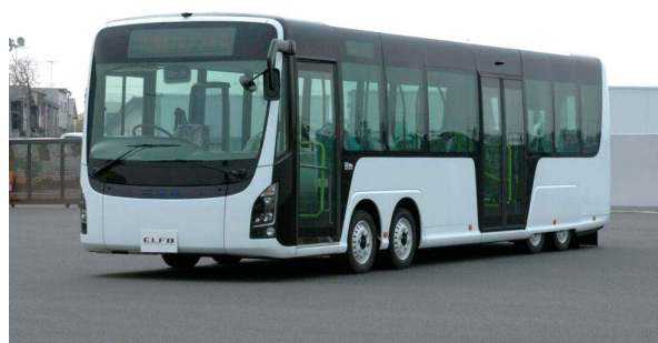
図3 慶應義塾大学で試作した大型電動低床フルフラットバスのフロントビュー

社団法人神奈川県バス協会によると、既存大型ノンステップバス（全長10.5mで全幅2.5m水準）は1kmの燃費は平均38円とのことであった（試作当時、以下同）。一方で、試作した大型電動低床フルフラットバスは同じ大型サイズで1km8円（夜間電力使用時）で走る。電動化で1kmあたり約30円の燃料面のメリットが認められている。路線バスは、全国的に