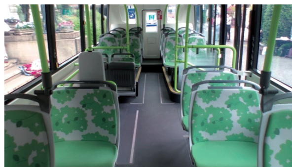
図4 慶應義塾大学が試作をした大型電動低床フルフラットバスの車内 試作のために後部座席下に段差が若干残ったものの、車内の後部までフルフラットな通路になった。