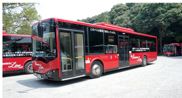
図6 京都急行バスが導入した中国BYD製のK9電動量産車

これからは買い物袋をもって遠くのバス停に向かう必要がなくなるかもしれない。乗り換え時の抵抗が減る。