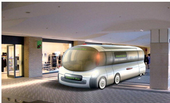
図5 電動バスがショッピングセンターに乗り入れたイメージ

これから排ガスと騒音を抑制できる電動車輛の活躍の幅が広がることに、異を唱える方は少ないだろう。この排ガスと騒音が出ないというメリットは、建物の中に入れるという革新性を持っている(図5)。従前の車は、排ガスと騒音があり建物の中に入り難かった。上記の試作車輛の実証走行での調査で、380名のモニターに質問したところ、電動バスを駅構内等へ延伸することで、乗り換え抵抗が小さくなるのであれば、平均で現行運賃の約3割増しの運賃を許容する(=最大3割増の運賃の支払意思がある)との評価も得られた。市民は一定の支払意思をもって電動バスの建物内への延伸までを期待している。